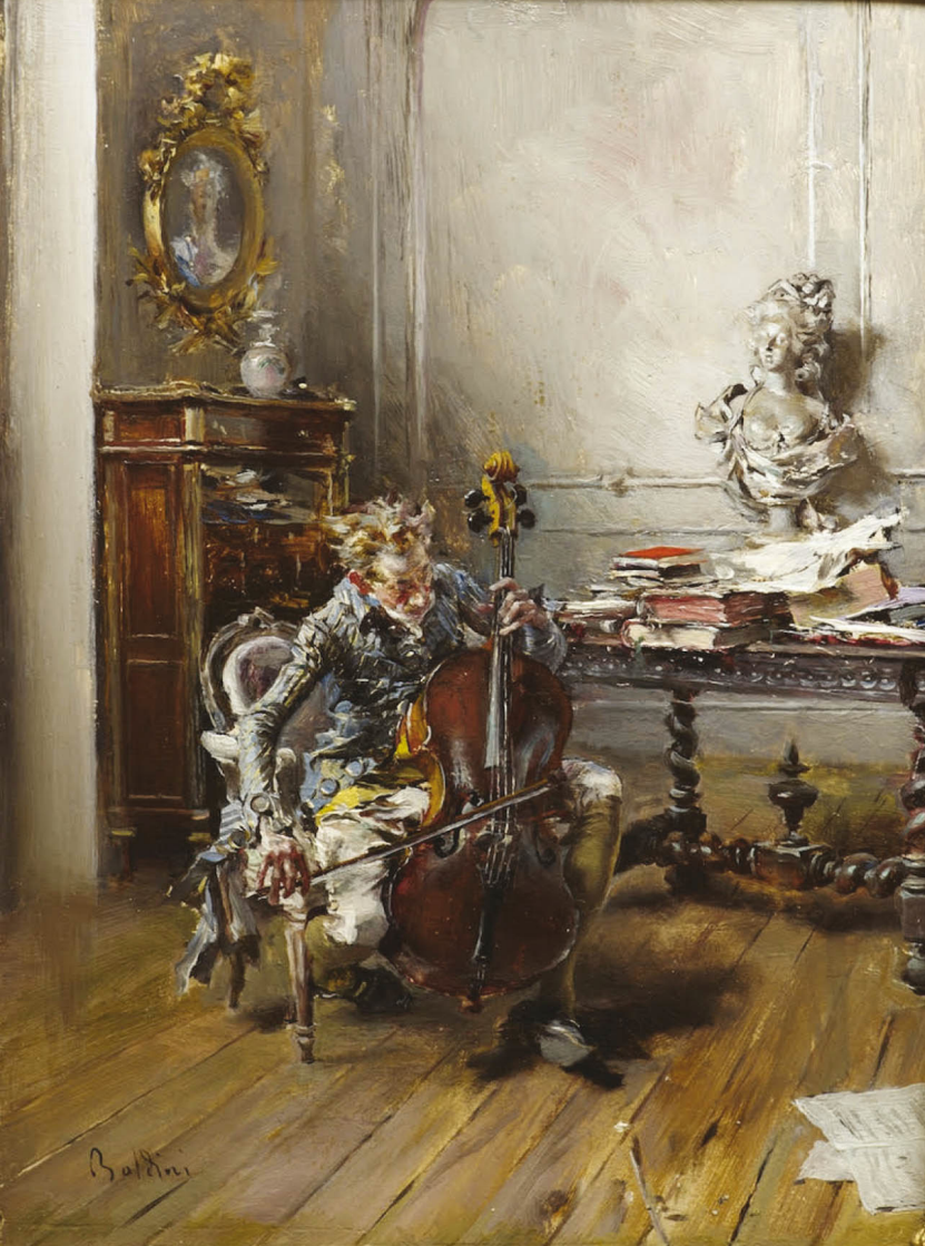
Giovanni Boldini, Il violoncellista , olio su tavola, 17,4 x 12,2 Donazione Alesi Cuccio Cartaino facente parte della collezione di Villa Zito, altra sede della Fondazione Sicilia.