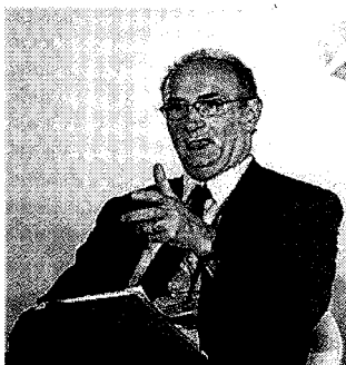
Finanza L'amministratore delegato di Unicredit Federico Ghizzoni